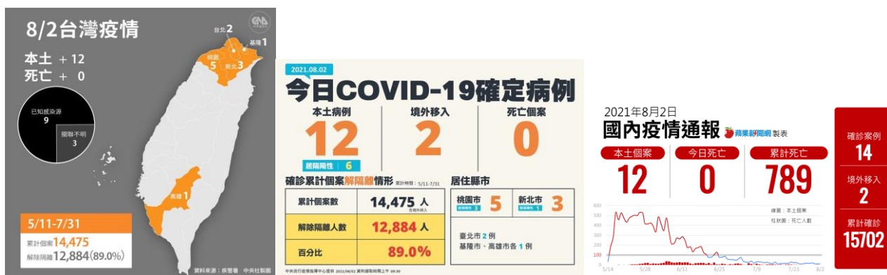
圖 1 8/2 本土確診新增圖

(一) 8 月 2 日本土確診新增 12 例，7/27-8/2 當週死亡 3 例，本土疫情詳見圖 1